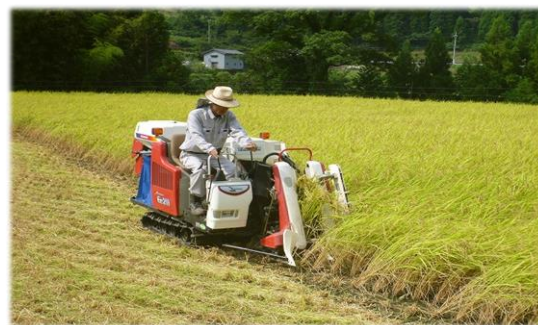
実りの秋・刈り取り風景

「実りの秋、食欲の秋」となりました。 農家では、実りの秋を迎え「イネの刈取り作業」 など農作業が忙しくなります。一年間の集大成の時期 です。好天に恵まれて、作業が順調にはかどることを 願っています。美味しい「お米」待ってま〜す。 特産品の「畑ヶ平大根」「うみゃーな〜米」「美方大 納言小豆」「ピーマン」「前村そば」の良い出来栄え も期待しています。